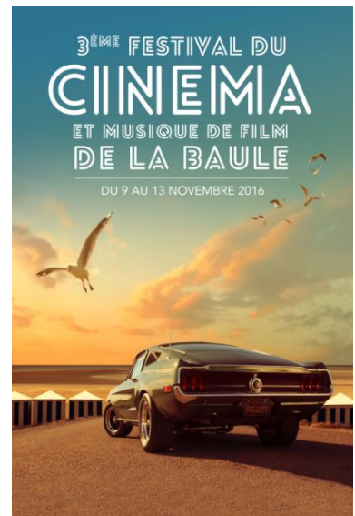
L'affiche du festival

Pour sa 3 ème édition le Festival du cinéma et musique de film de la Baule rendra hommage au grand compositeur de musique de film Lalo Schifrin (auteur entre autre des musiques de Mission Impossible, l'inspecteur Harry et Bullitt) ainsi qu'à l'acteur principal du film Bullitt, Steve McQueen.