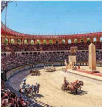
LES ÉPESSES / PARC À THÈME AU RENDEZ-VOUS DE L'HISTOIRE Puy du Fou ( Puydufou.com ).

P arc de loisirs préféré des Français, élu presque chaque année numéro 1 mondial des parcs à thème, le Puy du Fou n'a pas usurpé sa renommée ni sa réputation qui a largement dépassé les frontières de la Vendée. Entre ses reconstitutions de batailles antiques, médiévales ou modernes (à pied, sur mer, à cheval ou en char !), sa légendaire Cinéscène nocturne orchestrée avec tous les « Puyfolais », ses plongées dans la vie quotidienne de villages français du temps passé, ses spectacles historiques épiques ( Le Dernier Panache , Le Mystère de La Pérouse et le récent et sublime Mime et l'Étoile ), le plaisir et l'émotion sont partout. M. R.