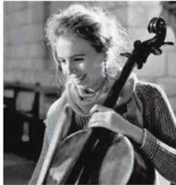
OUessant / MUSIQUE CLASSIQUE EMBRUNS FÉMININS Musiciennes à Ouessant Du 5 au 8 août ( Musiciennesaouessant.com ).

P arc de loisirs préféré des Français, élu presque chaque année numéro 1 mondial des parcs à thème, le Puy du Fou n'a pas usurpé sa renommée ni sa réputation qui a largement dépassé les frontières de la Vendée. Entre ses reconstitutions de batailles antiques, médiévales ou modernes (à pied, sur mer, à cheval ou en char !), sa légendaire Cinéscène nocturne orchestrée avec tous les « Puyfolais », ses plongées dans la vie quotidienne de villages français du temps passé, ses spectacles historiques épiques ( Le Dernier Panache , Le Mystère de La Pérouse et le récent et sublime Mime et l'Étoile ), le plaisir et l'émotion sont partout. M. R.